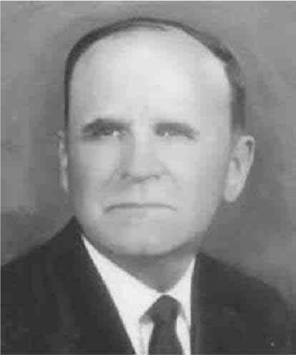
William Marrion Branham